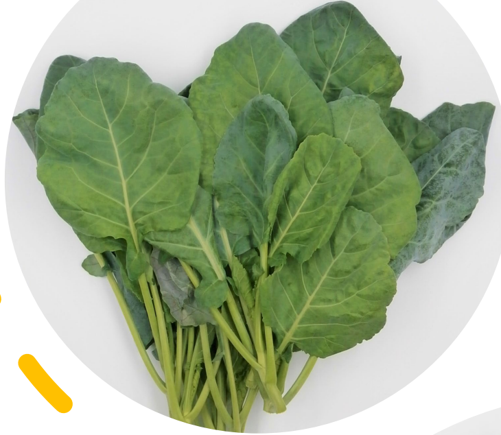
コラードケール (葉先が丸い)

一般的な「キッチンタイプ」に加えて「コラードタイプ」も生産を開始しました。 更に食べやすくなり 高いご評価を頂いております。