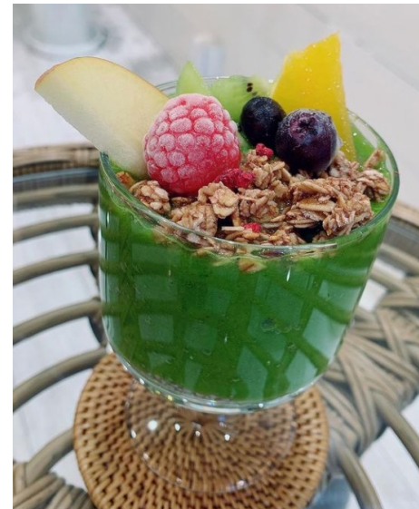
敦賀スムージーハウス グリーンスムージー