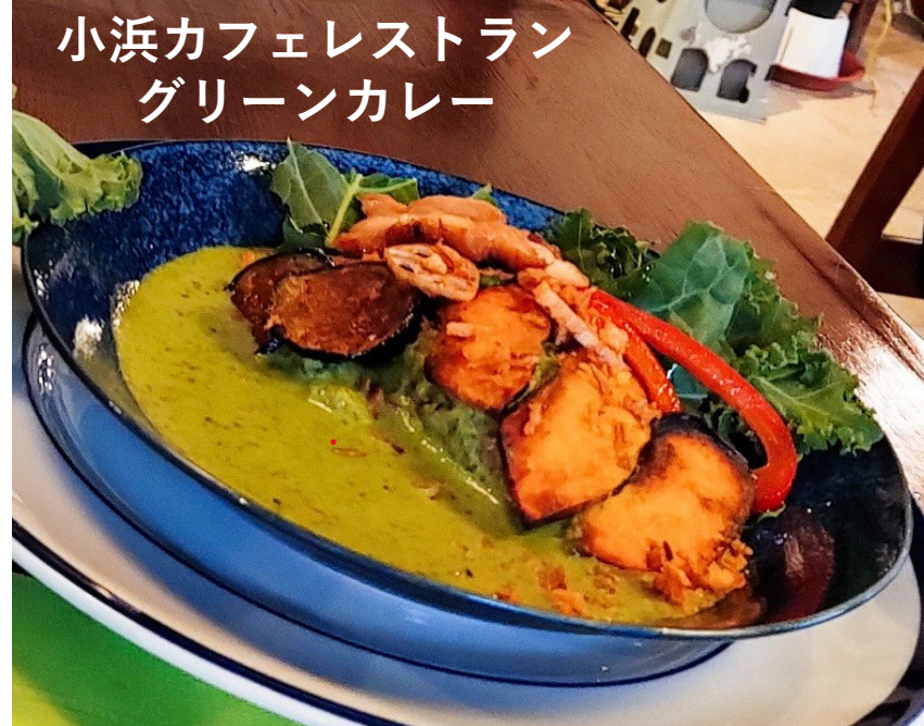
小浜カフェレストラン グリーンカレー