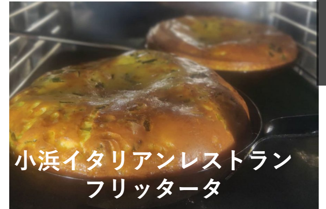
小浜イタリアンレストラン フリッタータ