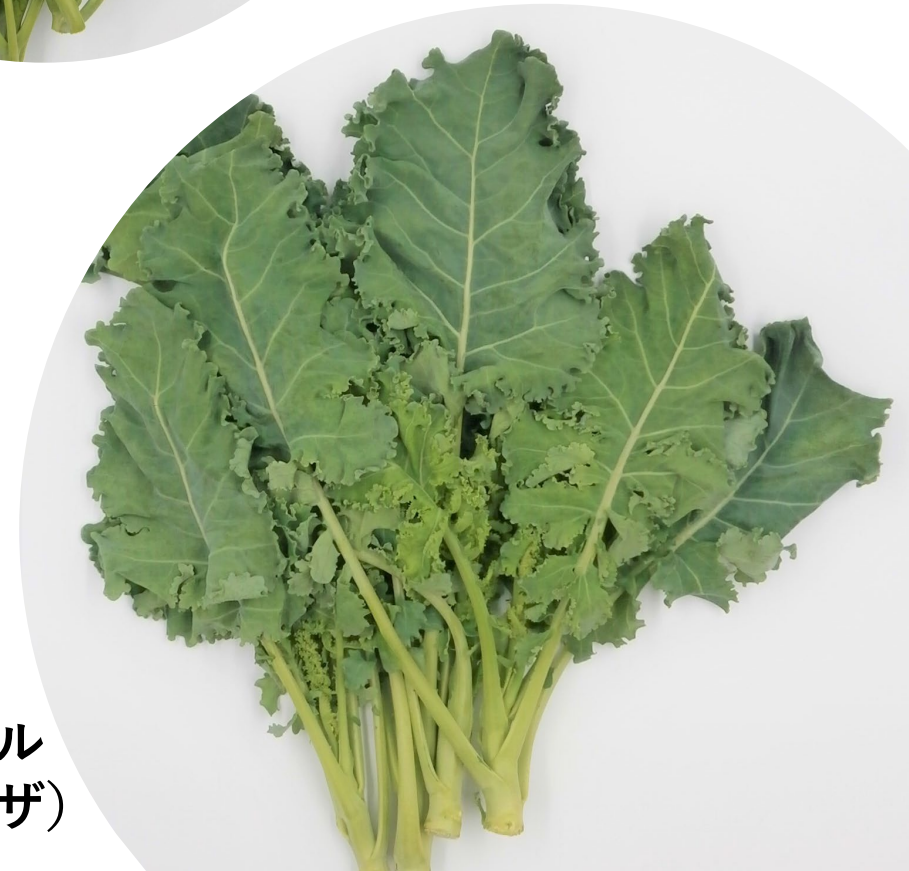
キッチンケール (葉先がギザギザ)