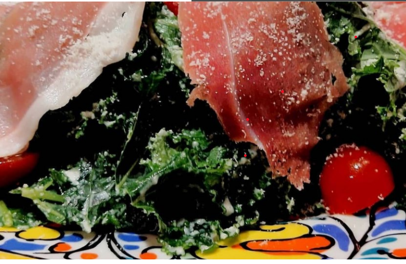
銀座イタリアンレストラン 生ハムサラダ